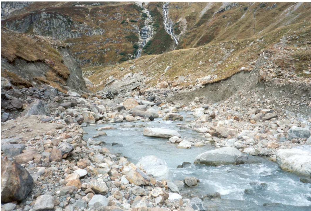
Abbildung 2: Zustand des Auslaufes des Steinsees am 2. Oktober 1998.