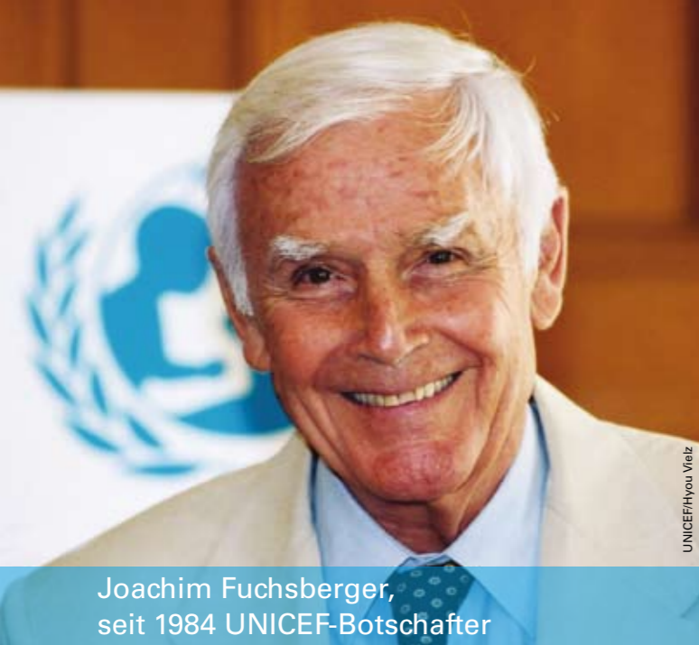
Joachim Fuchsberger, seit 1984 UNICEF-Botschafter

„Ich habe den Glauben nicht verloren, dass wir gemeinsam die Welt menschlicher machen können. Und ich bin überzeugt, dass wir bei den Kindern anfangen müssen.“