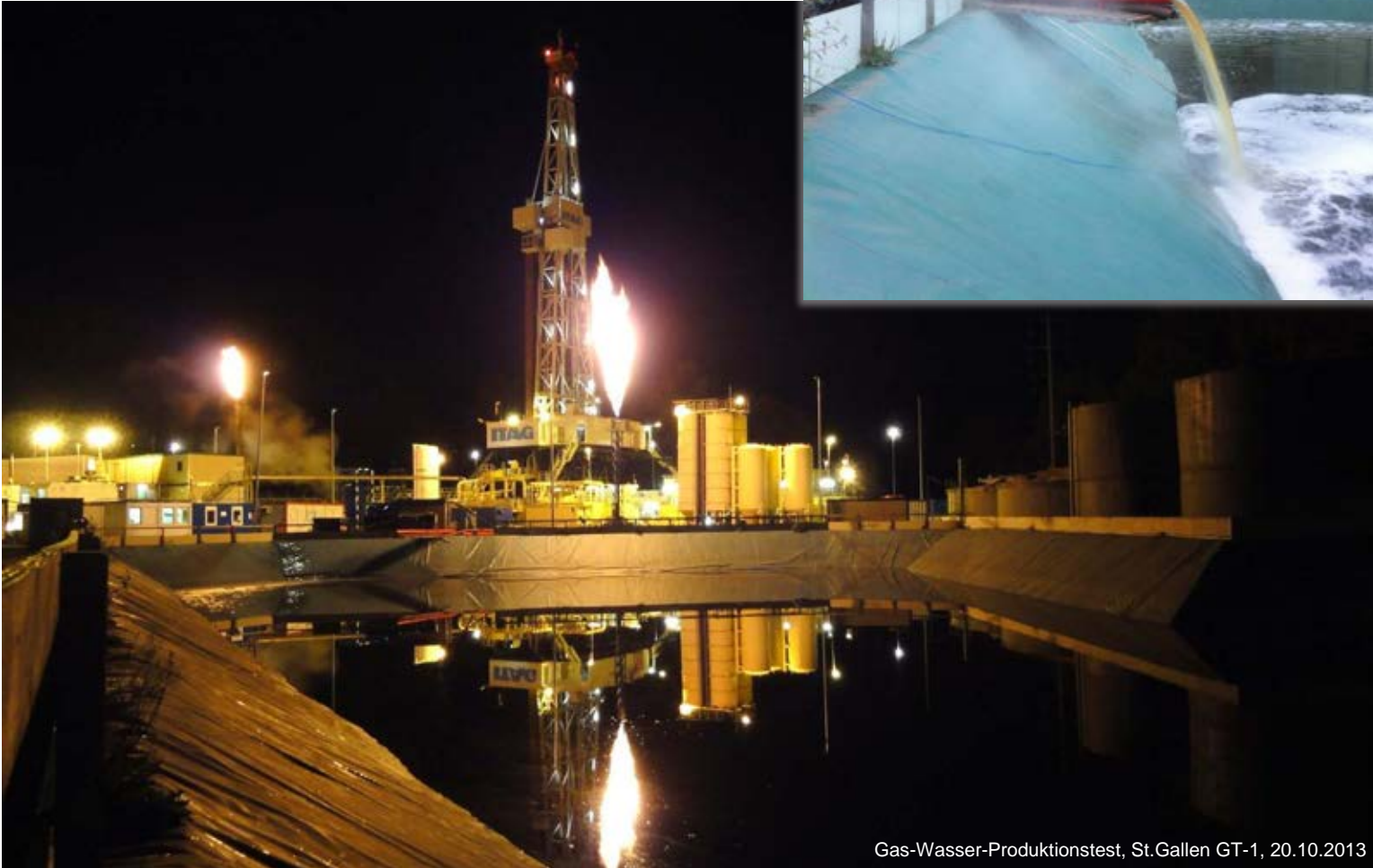
Gas-Wasser-Produktionstest, St.Gallen GT-1, 20.10.2013